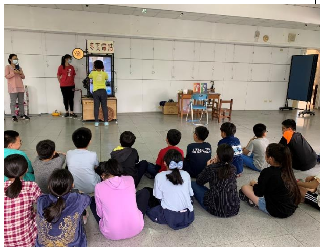
麥寶電波體驗活動紀實 1