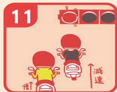
11 變紅燈不急煞車，提早煞車減速，避免後車搶快撞上