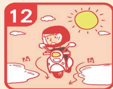
12 晴天時避開積水，可能是油漬