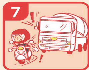
7 絕對不從大車前方超車