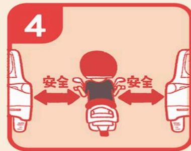
4 與路邊車輛保持距離