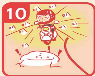
10 發現前方有異，開大燈並按喇叭提醒四周