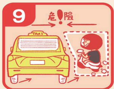
9 不從計程車右方衝過