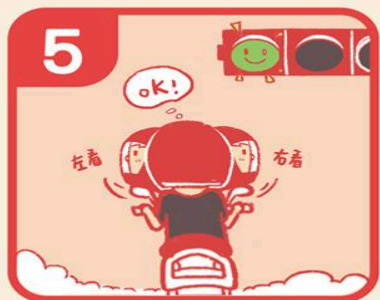
5 綠燈後，先確認左右再起步